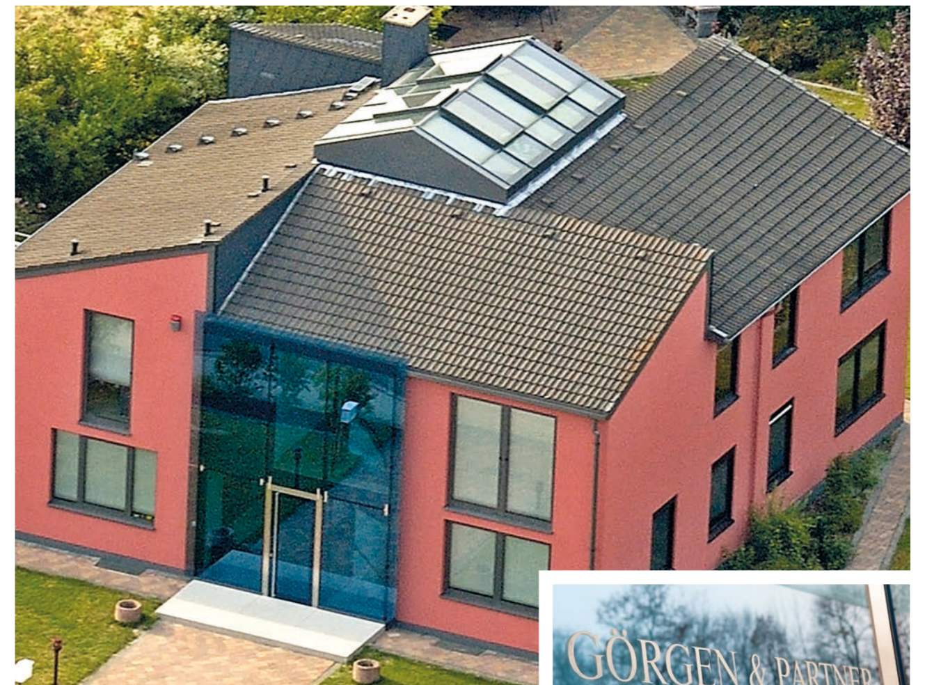
Foto oben: Kanzleigebäude in der Johann-Philipp-Reis-Straße 19 nach Fertigstellung 1984 | Foto unten: Kanzleigebäude heute